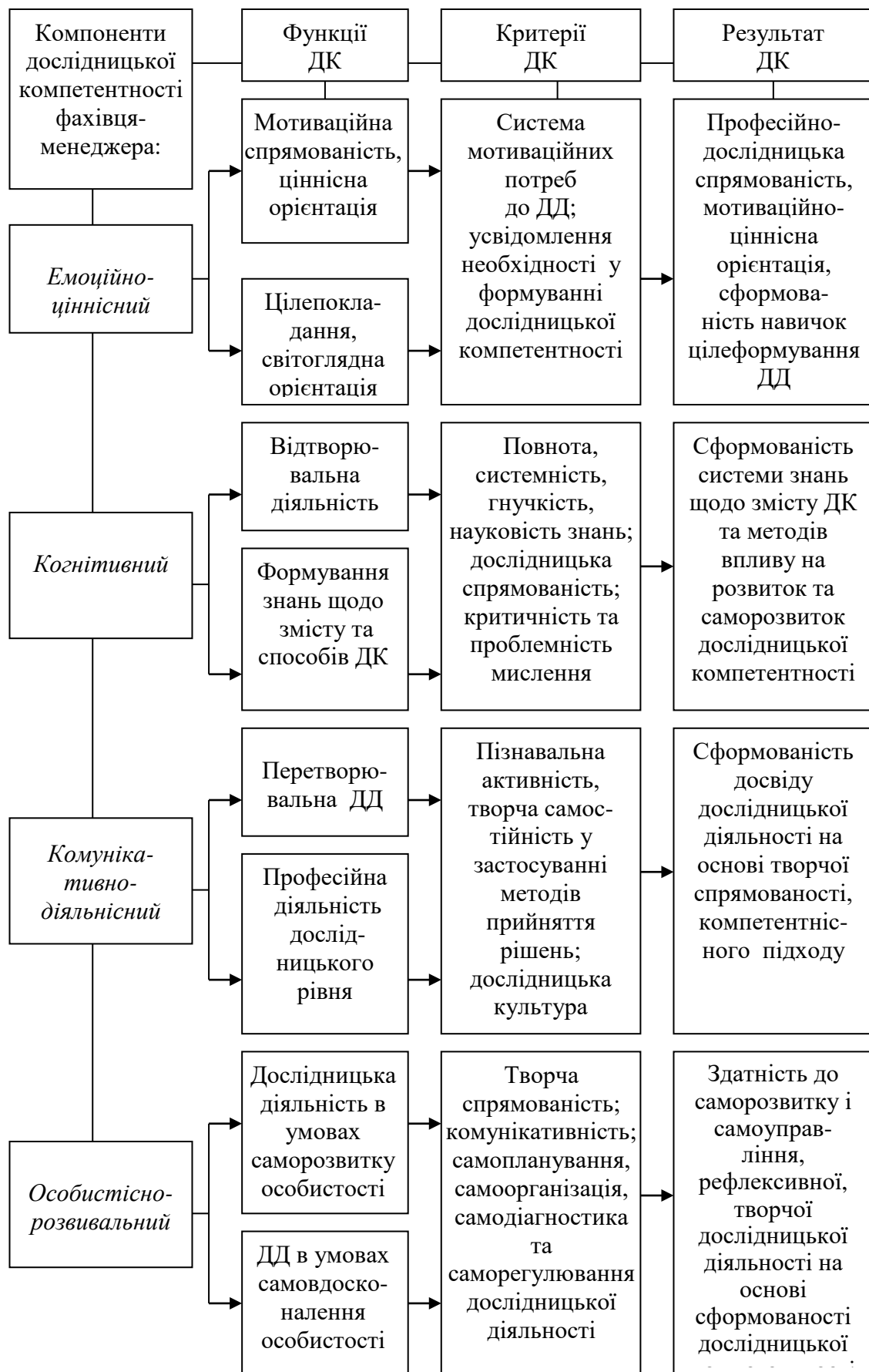
Рис. 1. Модель дослідницької компетентності аграрного менеджера